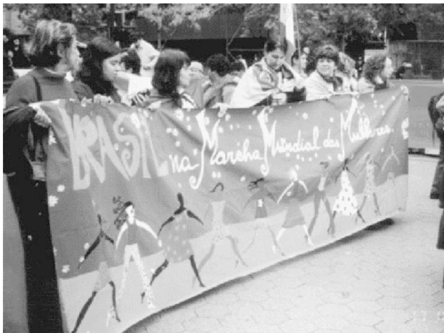
Sempreviva. Organização Feminista

Un nutrido calendario de actividades marcó, este año, el activismo de los movimientos antiviolencia, alrededor de las convocatorias lanzadas por redes regionales e internacionales para conmemorar el 25 de Noviembre. Grupos y ONG feministas y organizaciones sociales de mujeres de América Latina y el Caribe se hicieron presentes a través de marchas, foros, festivales musicales, performances de arte y manifiestos.