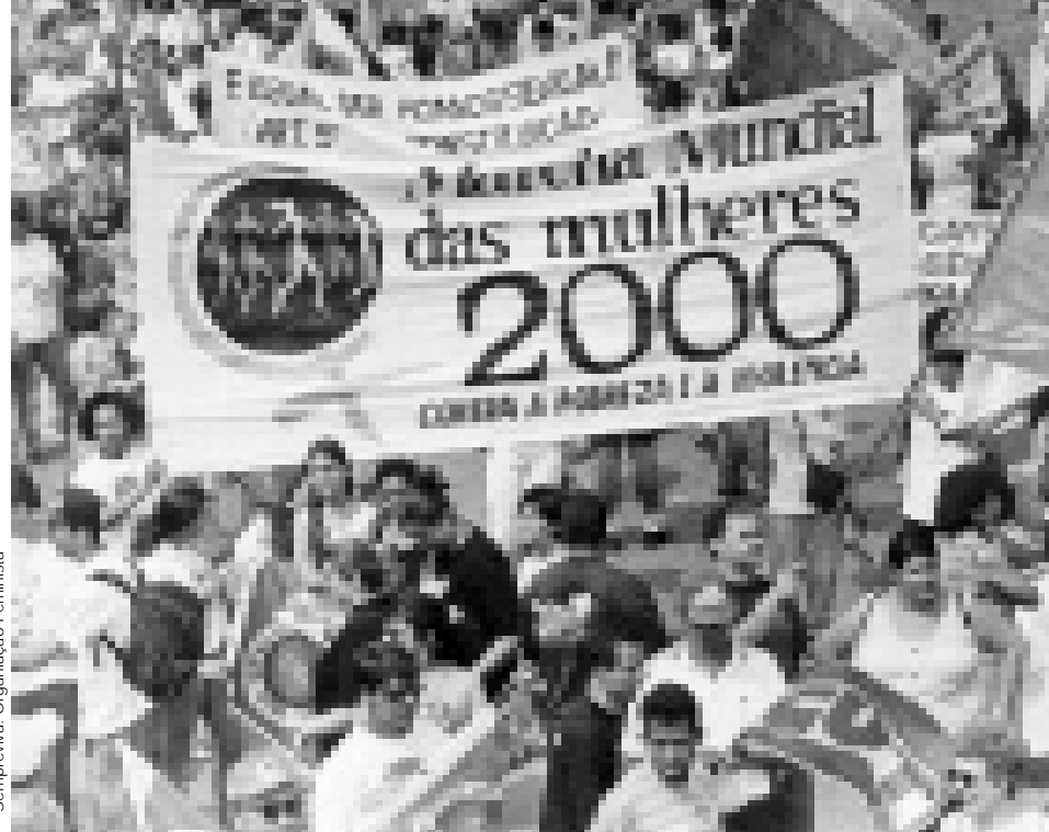
Sempreviva. Organização Feminista

Uno de los hechos más resaltantes del 2000 para el movimiento antiviolencia, fue la Marcha Mundial de las Mujeres 2000, que movilizó a unas veinte mil mujeres de organizaciones feministas y de los movimientos sociales provenientes de 159 países, quienes realizaron dos actos centrales durante los días 16 y 17 de octubre pasado, frente a las sedes del Banco Mundial y del Fondo Monetario Internacional, en Washington, y en Nueva York, respectivamente. En Washington, una delegación de la Marcha expuso sus demandas ante Horst Kohler, Presidente del Fondo Monetario Internacional, FMI, y ante James Wolfensohn, directivo del Banco Mundial, BM. Mientras que el 17, Día Mundial contra la Pobreza y fecha central de este evento, un grupo de las organizadoras se entrevistó en la sede