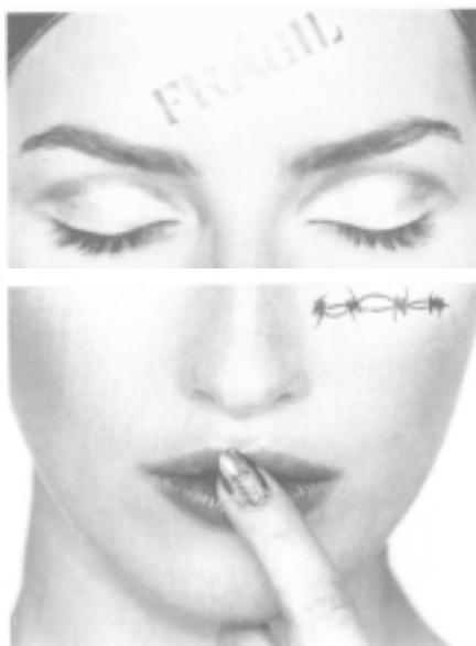
El Boletín, España

También, esta investigación determinó que la violencia intrafamiliar es un grave problema social presente en todas las localidades y que se expresa de diversas maneras en la vida cotidiana de las mujeres. Las entrevistadas vivieron diversos ciclos de agresión, en los que generalmente se combinaron diferentes manifestaciones de violencia: física, psicológica, sexual y patrimonial, lo que, con frecuencia, puso a muchas de ellas en grave riesgo. La impunidad de la violencia fue y sigue siendo una constante en estos ciclos de agresión. A pesar de su seriedad y de sus dimensiones, estas situaciones rara vez son consideradas en los registros de las instituciones, lo que permite su invisibilización.